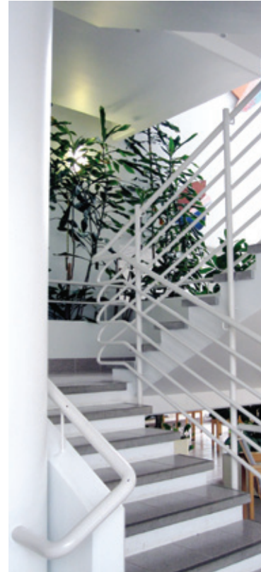
Ulkoasu: Annexus/Marsa Pihlaja.