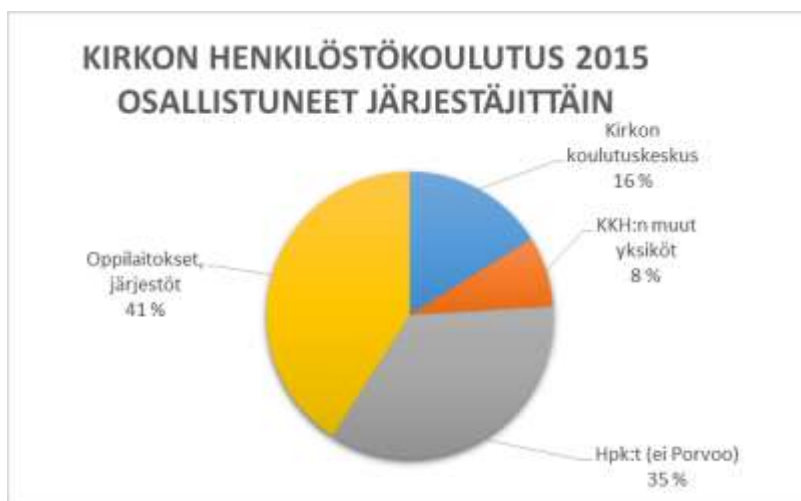
Kuva 1 Kirkon henkilöstökoulutuskalenterissa julkaistuista koulutuksista annetut toteumatiedot: koulutukseen osallistuneiden %-osuus järjestäjittäin vuonna 2015.

Kirkon koulutuskeskus kerää vuosittain tiedot koulutuskalenterissa ilmoitettujen koulutusten ja neuvottelupäivien toteutumisesta (kuva 1 ja kuva 2). Saatujen tietojen mukaan koulutuksiin ja neuvottelupäiviin osallistui vuonna 2015 kaikkiaan 10 497 henkilöä. Kirkon koulutuskeskuksen koulutuksiin osallistui 1 020 eli 16 % kaikista koulutuksiin osallistuneista (v. 2014 1 148). Kirkkohallituksen muiden yksikköjen koulutuksiin osallistui 506 (8 % koulutuksiin osallistuneista (2014: 194). Hiippakuntien koulutusten osallistujamäärät nousivat selkeästi edellisvuodesta ja neuvottelupäivien osallistujamäärät sen sijaan laskivat. Papit osallistuivat eniten KK:n ja diakoniatyöntekijät eniten hiippakuntien koulutuksiin. Pappien määrää selittää osaltaan pastoraalitutkinnon ja kirkon johtamiskoulutuksen toteutus KK:ssa. On kuitenkin muistettava, että henkilöstökoulutuskalenterin toteumatiedot eivät kerro koko totuutta, sillä varsinkin tukipalvelujen henkilöstökoulutuksen osalta tiedot ovat puutteelliset.