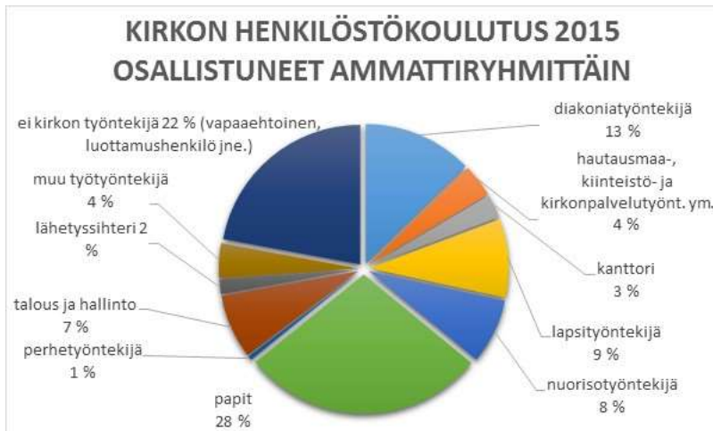
Kuva 2 Kirkon henkilöstökoulutuskalenterissa julkaistuista koulutuksista annetut toteumatiedot: koulutukseen osallistuneiden %-osuus ammattiryhmittäin vuonna 2015.